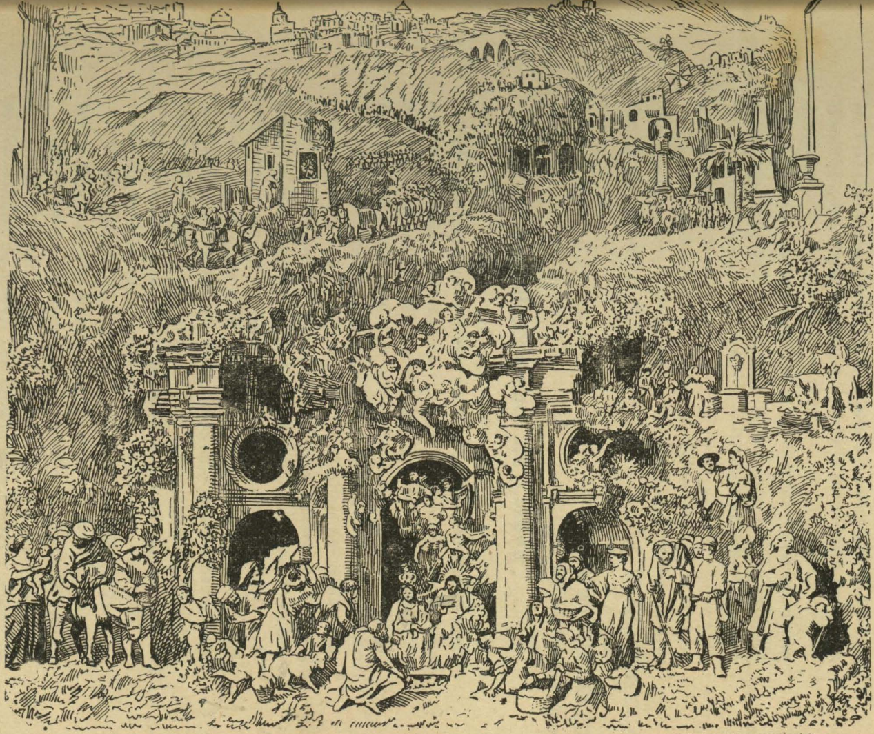
Presepio da Sé